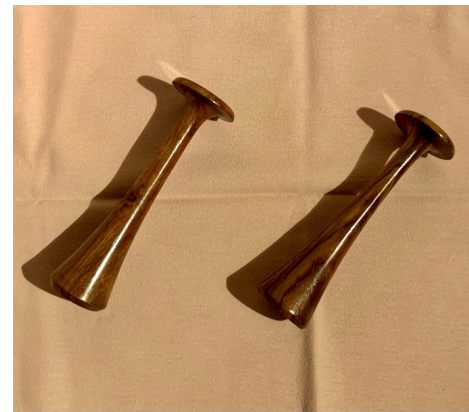
PINARD STETHOSKOP CHF 25.-