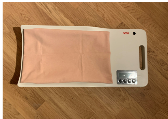
SÄUGLINGSWAGE CHF 890.-