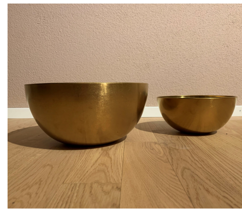
PLAZENTASCHALE CHF 40.- / CHF 30.-