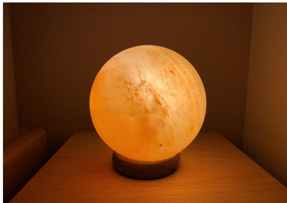
SALZLEUCHE CHF 60.-