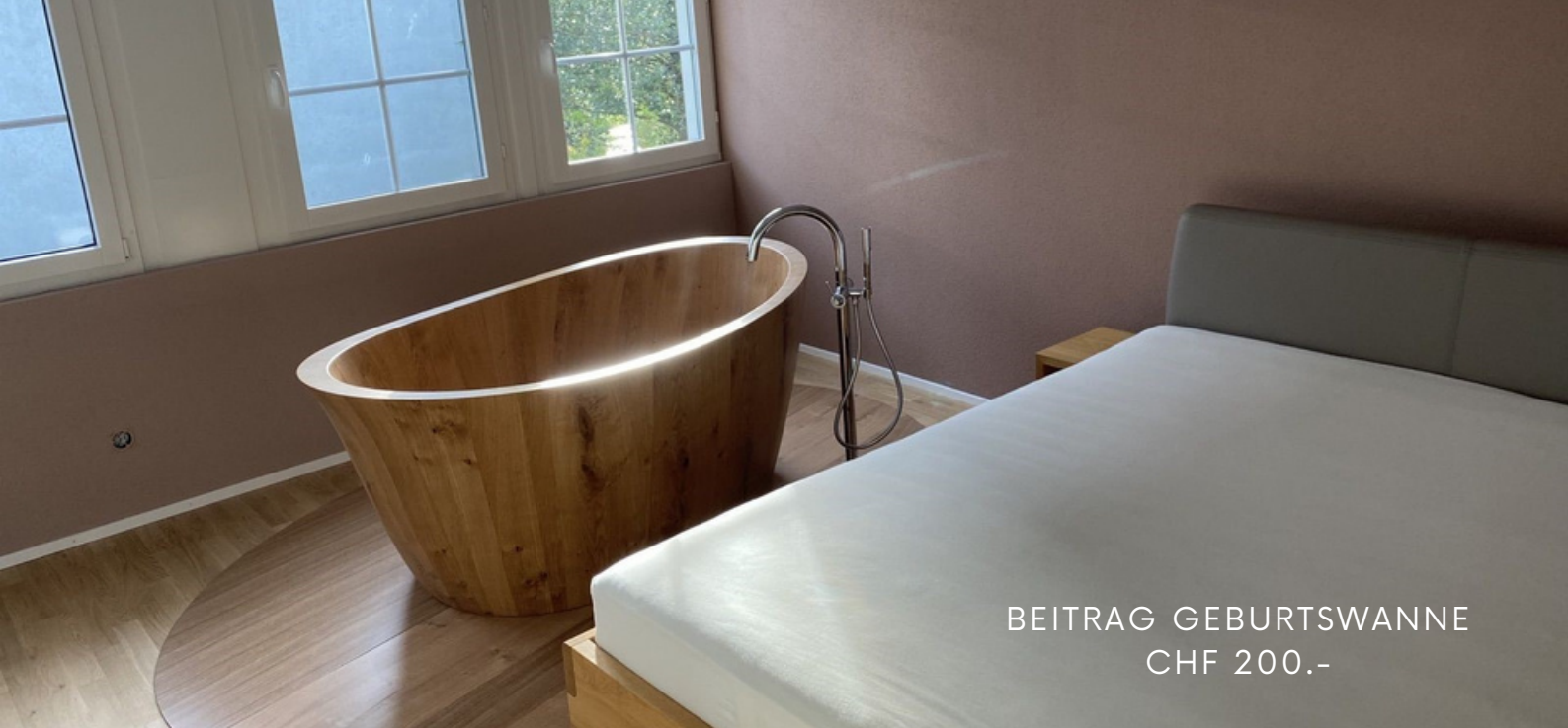
BEITRAG GEBURTSWANNE CHF 200.-