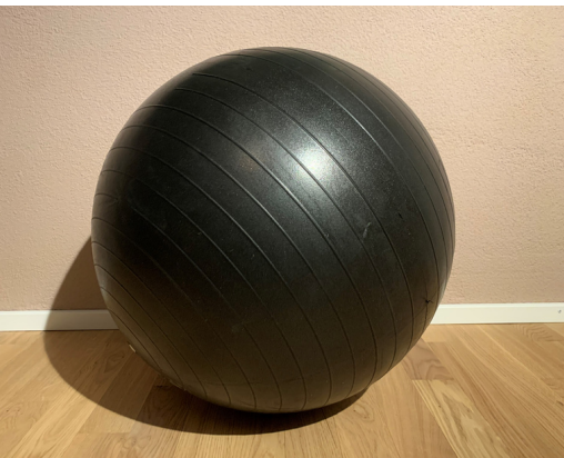
GYMNASTIKBALL CHF 15.-