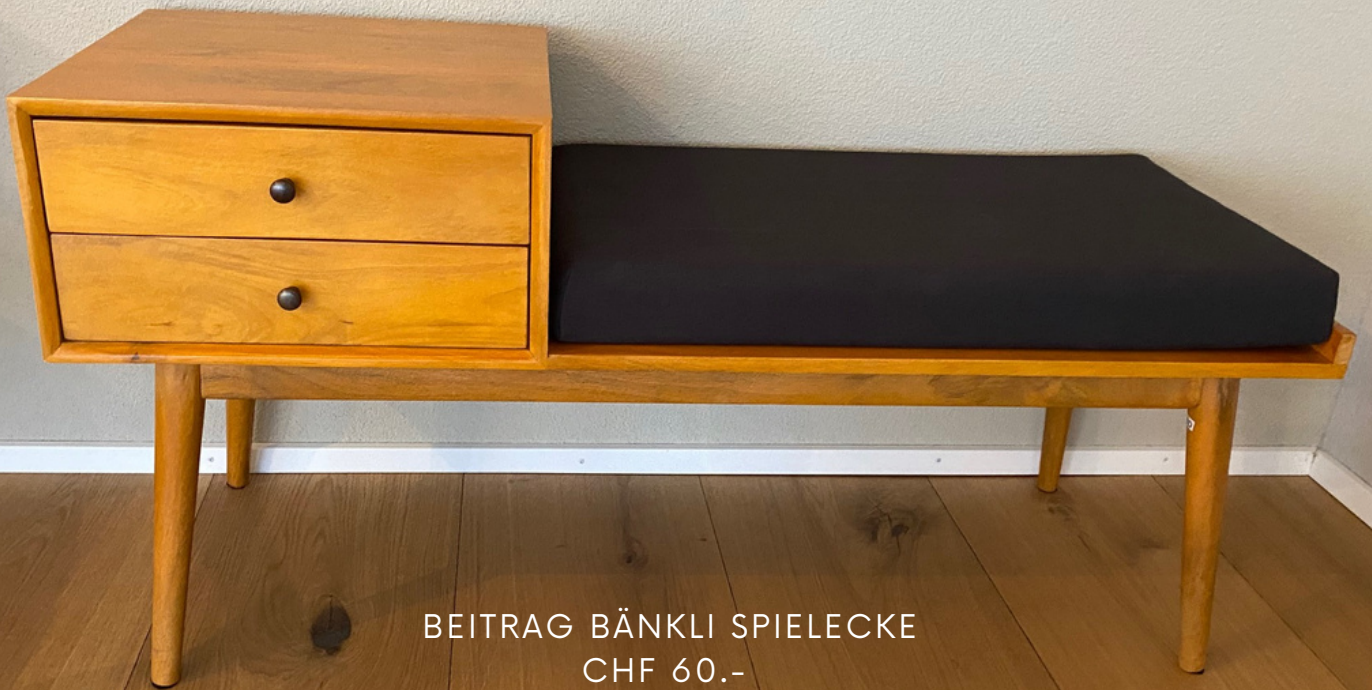
BEITRAG BÄNKLI SPIELECKE CHF 60.-