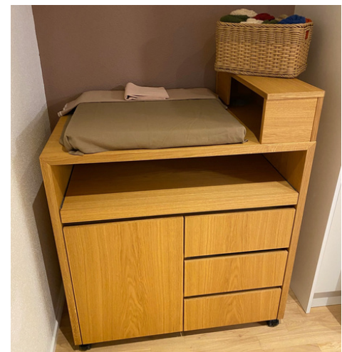
BEITRAG WICKELTISCH CHF 100.-

HAUS FÜR GEBURT FAMILIE GESUNDHEIT LUZERN